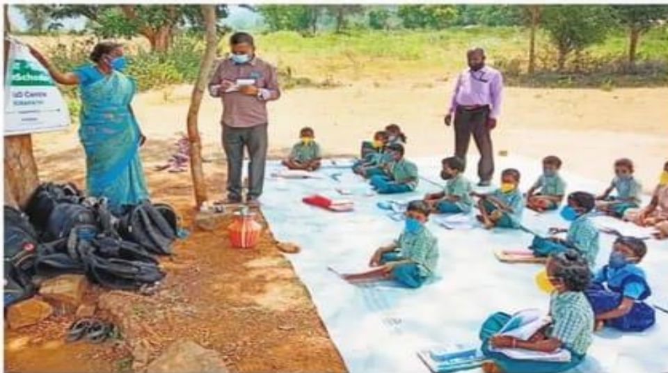
Volunteers handling classes for tribal students amid the pandemic | EXPRESS