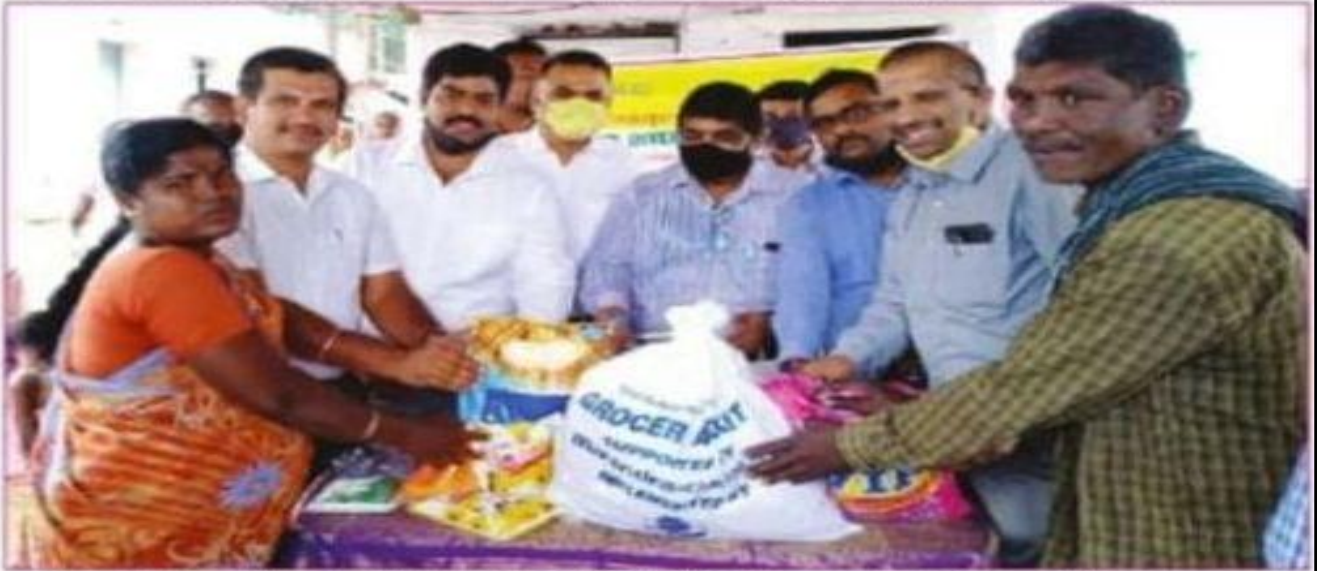
என்.எம்.சி.டி. சேவை நிறுவனம் சார்பில் கோவை ஆனைக்கட்டி சொரண்டி மலை கிராமத்தில் அத்தியாவசிய பொருட்கள் வழங்கப்பட்டது.