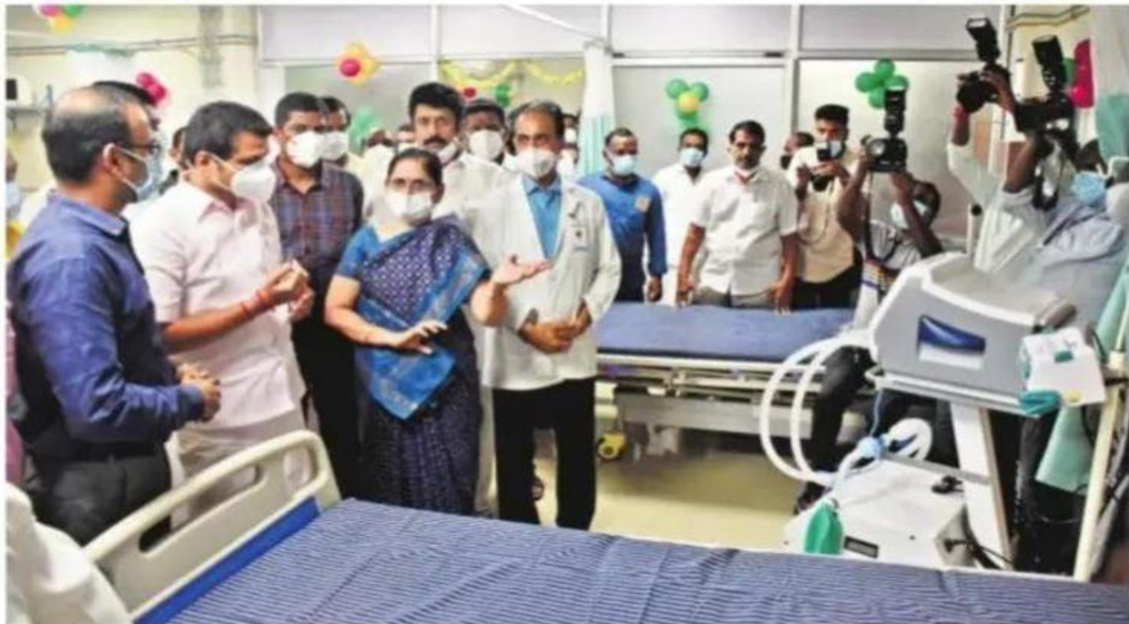
Electricity Minister V Senthil Balaji inaugurating the renovated stroke intensive care unit and paediatric ward at Coimbatore Medical College Hospital on Saturday