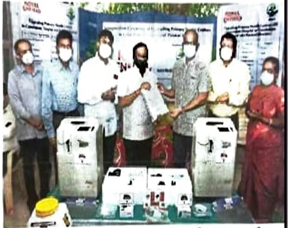
• பொள்ளாச்சி அருகே, தெகமம் ஆரம்ப சுகாதார நிலையத்துக்கு 'தேடிவ் மெடிகேர் அறக்கட்டளை' மற்றும் நாயல் என்யீட்டு திருவனங் சார்பில், மருத்துவ உபகரணங்கள் வழங்கப்பட்டன.