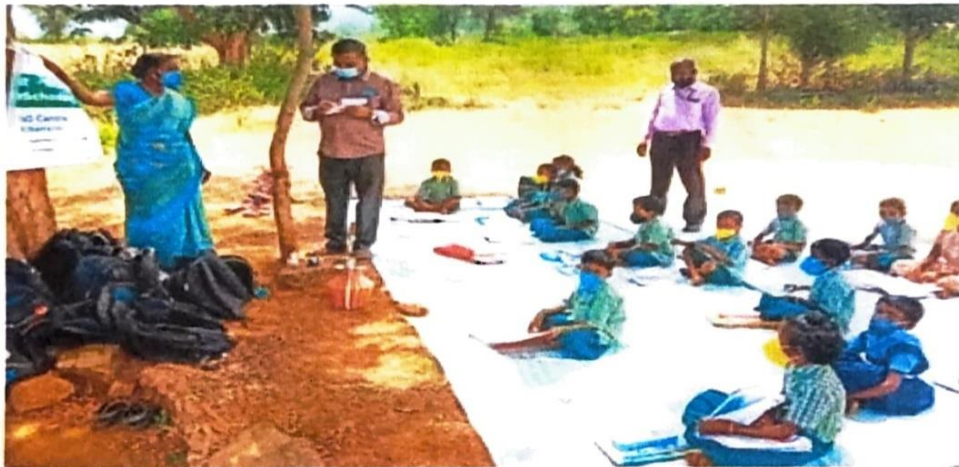
Volunteers handling classes for tribal students amid the pandemic | EXPRESS