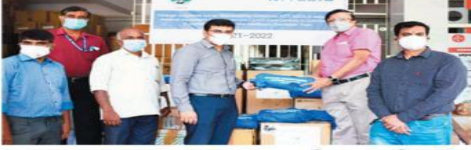
கோவை, மே. 23-