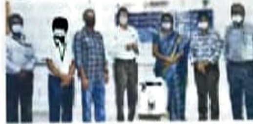
• திருப்பூர் தனியார் அறக்கட்டளை சார்பில் அரசு மருத்துவமனைக்கு ஒரு ஆக்ஸிஜன் கான்சன்டேட்டர் வழங்கப்பட்டது.

திருப்பூர், ஜூன் 19: கோயோனா சமூக அமைதி செயலகப் பரவியதற்குத் தடுப்பில் தமிழக அரசு பலவேறு முயற்சிகள் தீவிர நடவடிக்கைகள் மேற்கொண்டு வருகிறது இதனால் தற்போது திருப்பூர் மாவட்டத்தில் கோயோனா பரவல் குறைந்து வருகிறது திருப்பூர் அரசு மருத்துவமனை தனிமருத்துவமனையில் கோயோனா நோயாளிகளின் ஆக்ஸிஜன் தேவைகளை தமிழக அரசு,